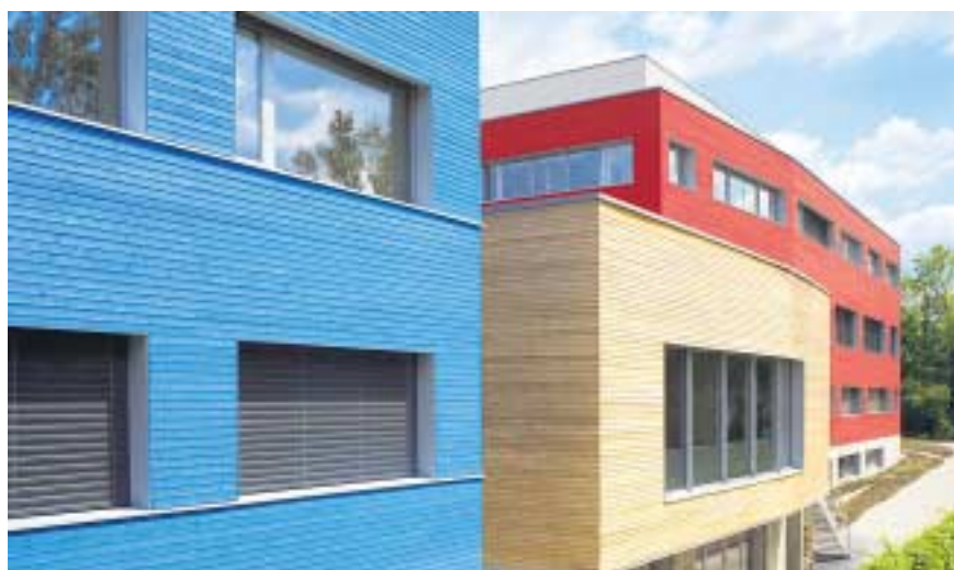
Effizient. Das neue Weleda-Gebäude wurde nach ökologischen Kriterien gebaut.

Für nachhaltiges ökologisches Wirtschaften ausgezeichnet